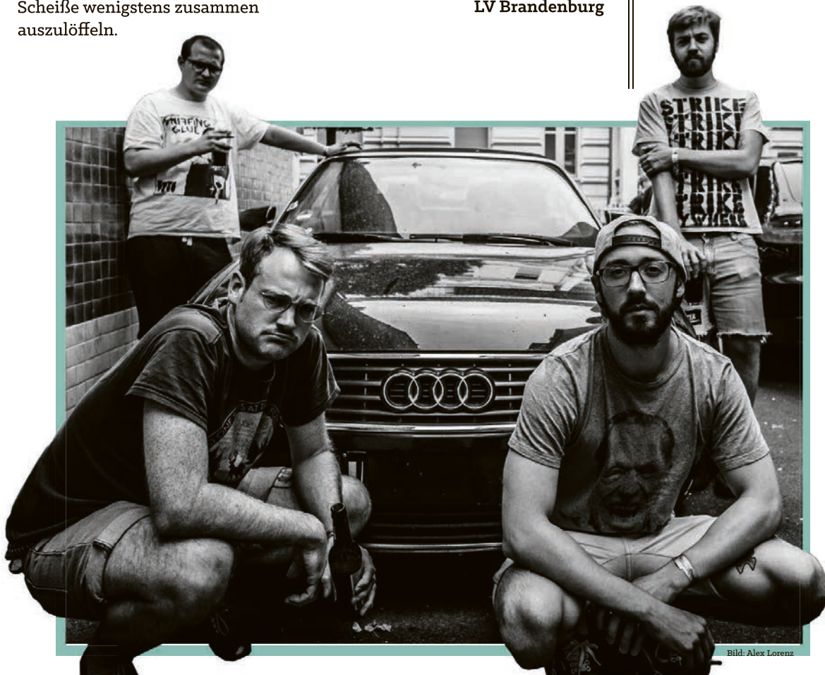
Söhne ihrer Klasse