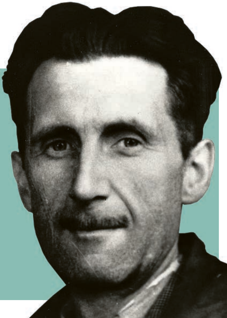
Portrait von George Orwell 1943 Branch of the National Union of Journalists (BNUI)

2. Wahrheit und Argumentation nützen im Zweifel gar nichts. Denn die materielle Gewalt lässt