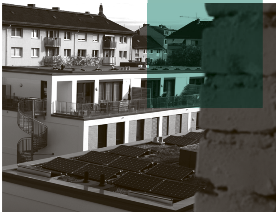
Beispiel für Innenverdichtung