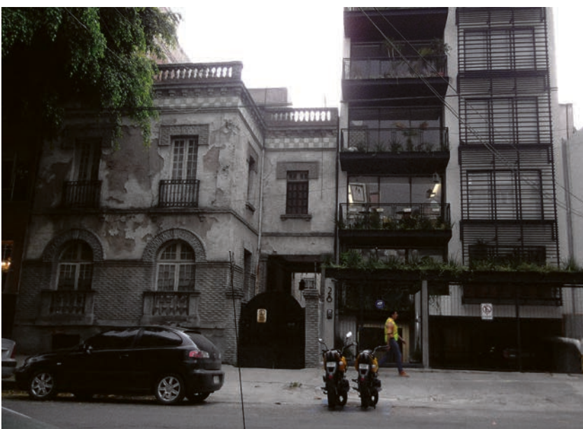
Neoklassizistisches Haus von 1920 neben einem Neubau von 2000 in Mexico-City