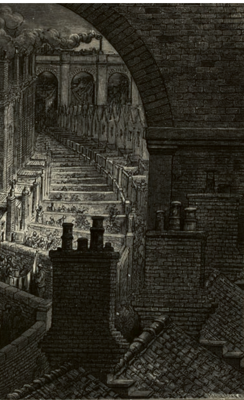
Arbeiterviertel in London 1870