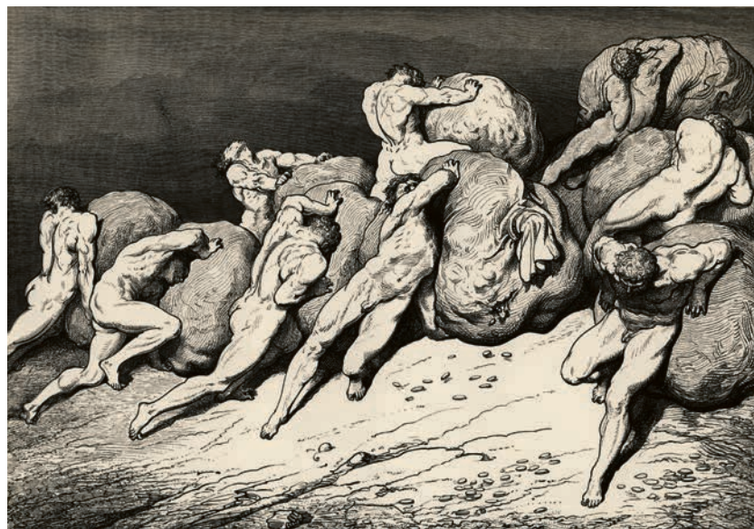
Dante: Wie die Moral uns niederdrückt