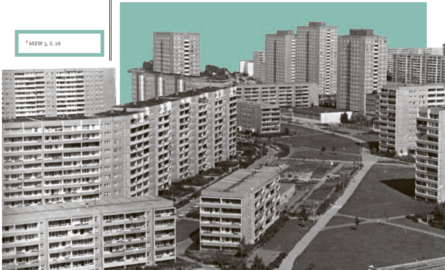
Wohnblock im Neubaugebiet Berlin-Marzahn 1987