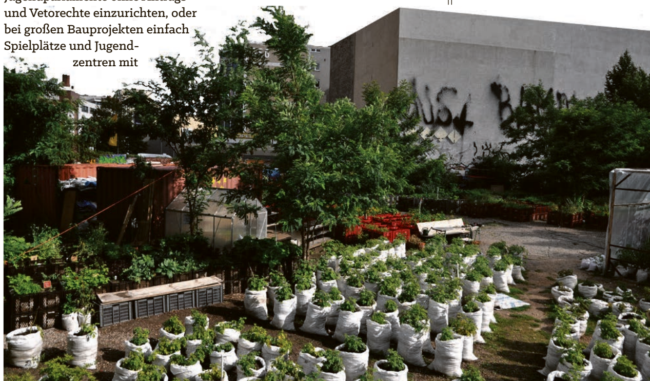
Grüne Oase im Beton

Die Schreberjugend wurde 1864 zur Zeit der Industrialisierung in Leipzig gegründet und ist damit der älteste Jugendverband Deutschlands. Schwerpunkte der Arbeit der Schreberjugend sind Umweltbildung und politische Bildung. Von Entspannung und Spaß in urbanen Gärten bis zu internationalen Jugendbegegnungen können junge Menschen hier vielfältigen Aktivitäten nachgehen und sich mit ihren Interessen im Verband einbringen.