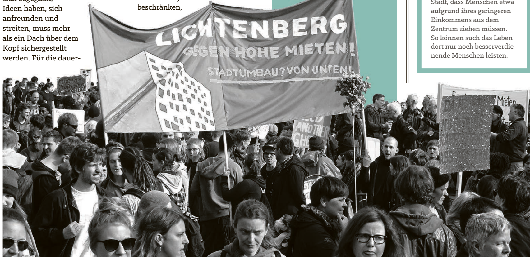
Mietenwahnsinn-Demo Berlin am 14.04.2018

2 Segregation bedeutet Trennung, im Fall von Stadt, dass Menschen etwa aufgrund ihres geringeren Einkommens aus dem Zentrum ziehen müssen. So können sich das Leben dort nur noch besser verdienende Menschen leisten.